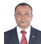
مجلس دى سيرة مجلس سيرة