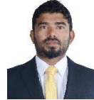
مجلس دى سيرة مجلس سيرة