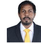
مجلس دى سيرة مجلس سيرة