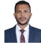
مجلس دى سيرة مجلس سيرة