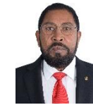
مجلس دى سيرة مجلس سيرة