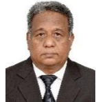
مجلس دى سيرة مجلس سيرة