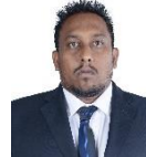
مجلس دى سيرة مجلس سيرة