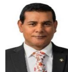
مجلس دى سيرة مجلس سيرة