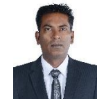
مجلس دى سيرة مجلس سيرة