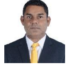
مجلس دى سيرة مجلس سيرة