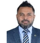
مجلس دى سيرة مجلس سيرة