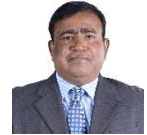
مجلس دى سيرة مجلس سيرة