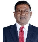
مجلس دى سيرة مجلس سيرة