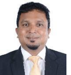
مجلس دى سيرة مجلس سيرة