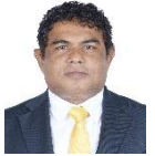
مجلس دى سيرة مجلس سيرة