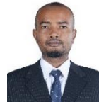
مجلس دى سيرة مجلس سيرة