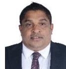
مجلس دى سيرة مجلس سيرة