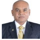
مجلس دى سيرة مجلس سيرة