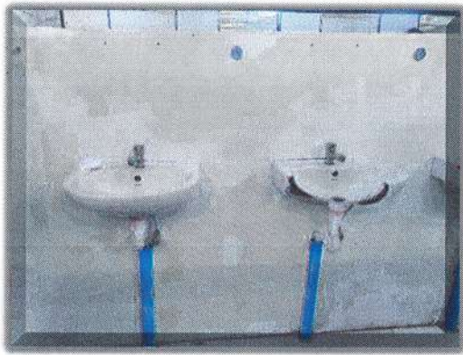
21. 2021/2 PT/M19: 2021/2

20. 2021/2 PT/M19: 2021/2 2021/2 PT/M19: 2021/2