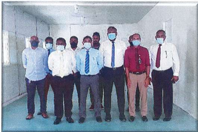
23. 2021/2 PT/M19: 2021/2