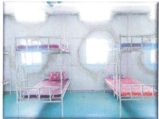
20. 2021/2 PT/M19: 2021/2