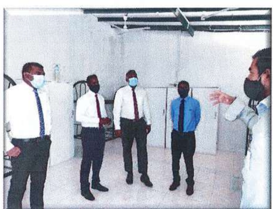
تاریخ: 14: سائنس و تكنولوجي کے شعبہ کے ایجوکیشنل پروگرامز کے لیے ایجوکیشنل سٹوڈنٹس کے لیے ایجوکیشنل پروگرامز کی فراہمی؛

Official stamp of the Government of Sindh and a handwritten signature in blue ink.