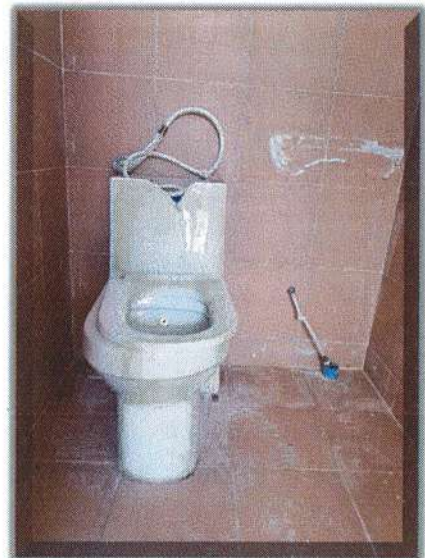
22. 2021/2 PT/M19: 2021/2