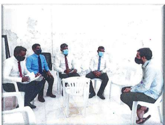
تاریخ: 15: سائنس و تكنولوجي کے شعبہ کے ایجوکیشنل پروگرامز کے لیے ایجوکیشنل سٹوڈنٹس کے لیے ایجوکیشنل پروگرامز کی فراہمی؛

ایجوکیشنل پروگرامز کے لیے ایجوکیشنل سٹوڈنٹس کے لیے ایجوکیشنل پروگرامز کی فراہمی؛